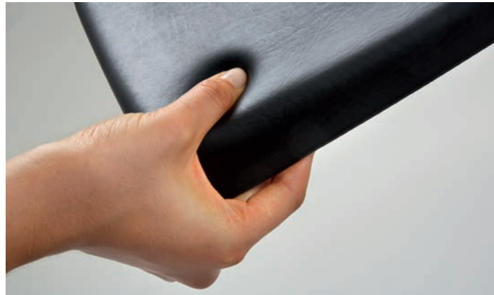
frolli-PUR ® ca. 35 Shore A - mittel hart