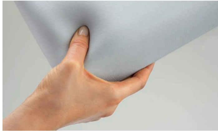
frolli-PUR ® ca. 15 Shore A - besonders weich