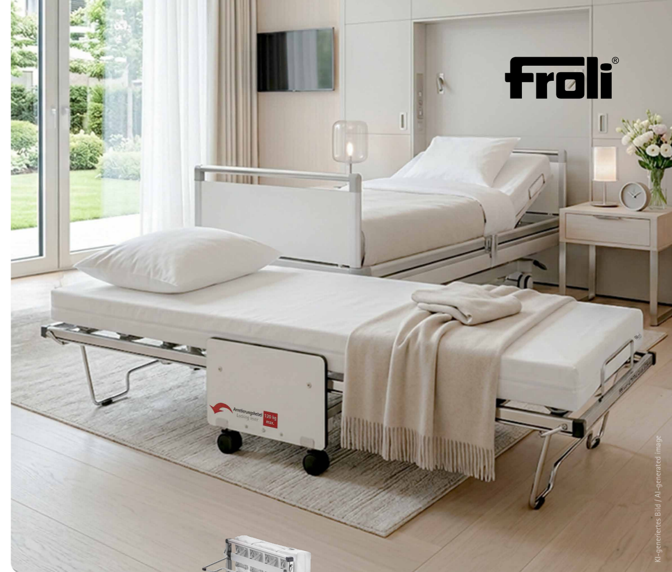
KI-generiertes Bild / AI-generated image