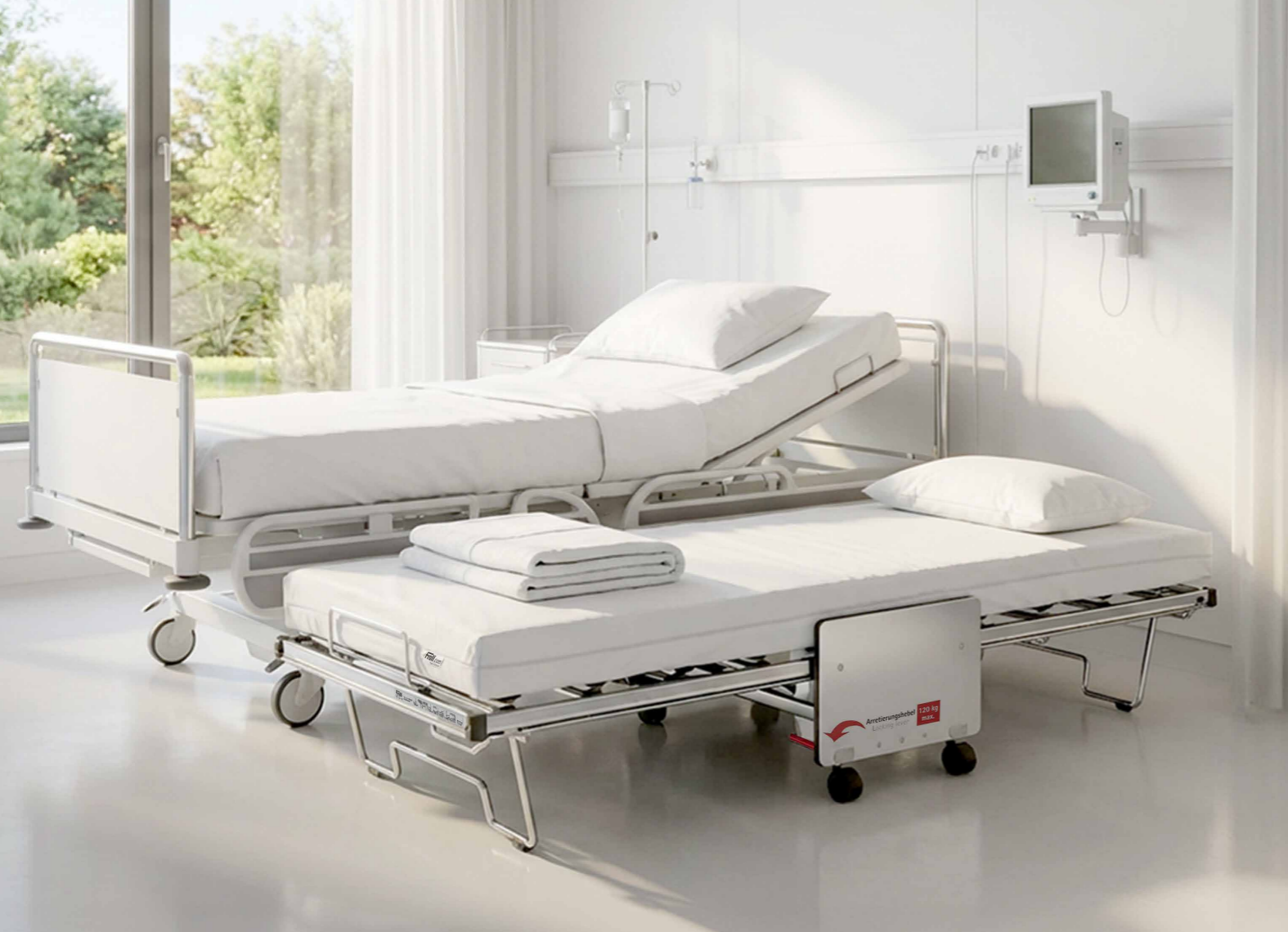
KI-generiertes Bild / AI-generated image